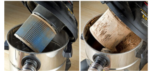
With Air Flux separator