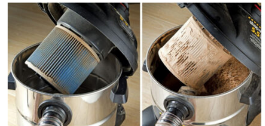
With Air Flux separator