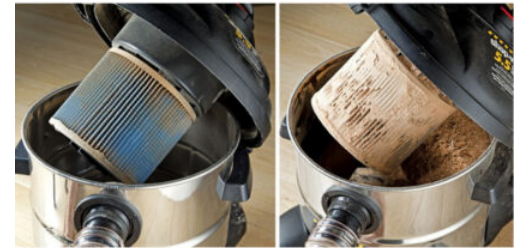
With Air Flux separator