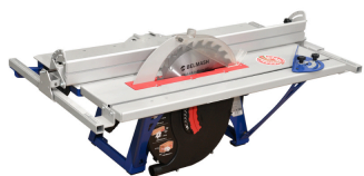
BELMASH - SDM2500 Scie et raboteuse