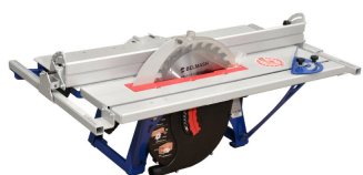
BELMASH - SDM2500 Scie et raboteuse