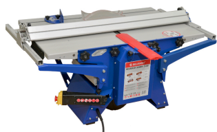
BELMASH - SDMR2500 scie et raboteuse/dégauchisseuse