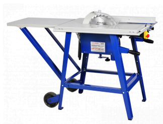
BELMASH - table de scie CBS2400