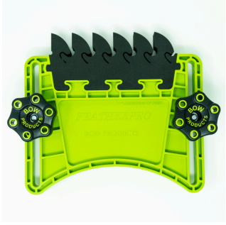
BOW FeatherPRO FP1 pince à ressort