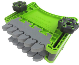
BOW FeatherDUO FP3 pince à ressort