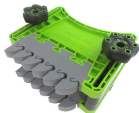
BOW FeatherDUO FP3 pince à ressort