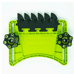
BOW FeatherPRO FP1 pince à ressort