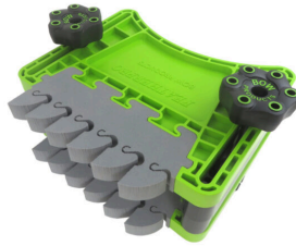
BOW FeatherDUO FP3 pince à ressort