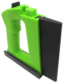
BOW GuidePRO GP5