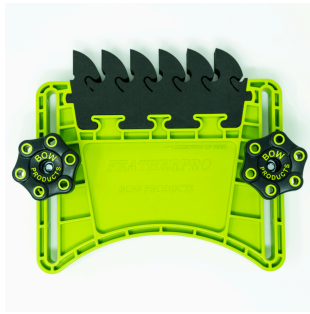
BOW FeatherPRO FP1 pince à ressort