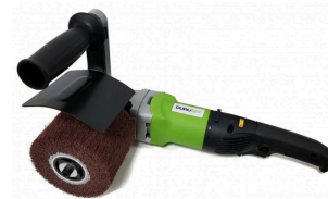
Durotec brosseuse de structure WT100/800DE