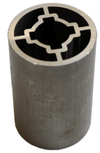
Durotec bague d'espacement Duro-Spacer