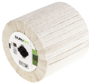
Durotec brosse abrasive Duro-Flap