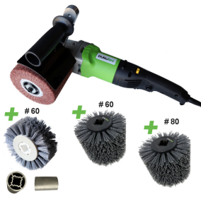
Durotec brosseuse de structure | Promoset WOOD