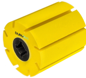
Durotec brosse de polissage Duro-Polish