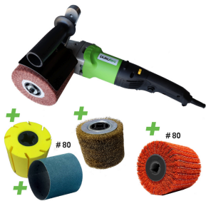
Durotec brosseuse de structure | Promoset METAL