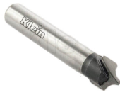
Fraise pour quart de rond R5 (Z=2) queue 8mm - Ø12mm