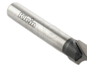
Fraise pour quart de rond R3 (Z=2) queue 8mm - Ø8mm