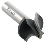
Fraise pour quart de rond R4 (Z=2) queue 8mm - Ø14mm