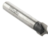
Fraise pour quart de rond R4 (Z=2) queue 8mm - Ø10mm