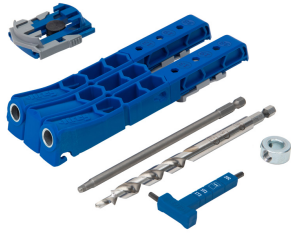
Kreg Pocket-Hole Jig 320