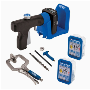
Kreg Pocket-Hole Jig 520 Pro