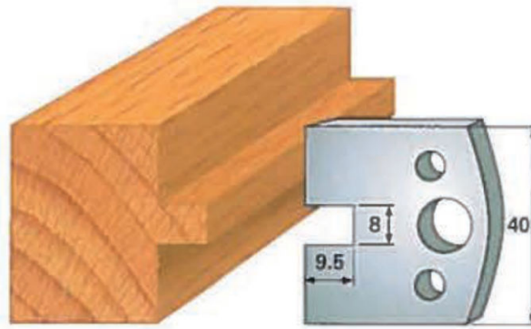
Art. SA0095 - (SA1095)