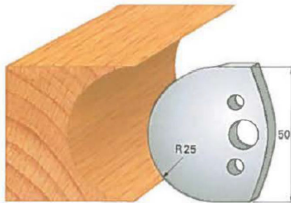
Art. SA2043 - (SA3043)