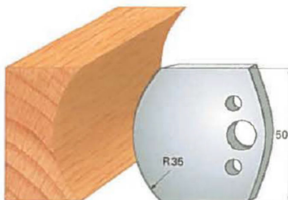
Art. SA2045 - (SA3045)