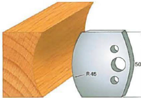
Art. SA2054 - (SA3054)