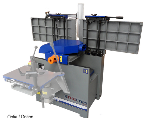
Optie / Option Boortafel / Drilling table / Table à mortaiser