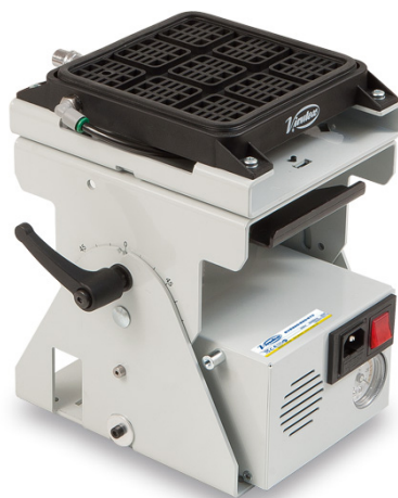
TABLE À VIDE ÉLECTRIQUE SVE660 - MULTI