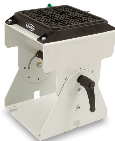
TABLE À VIDE ÉLECTRIQUE SVE680 - SUPPORT AUXILIAIRE INCLINABLE 90°