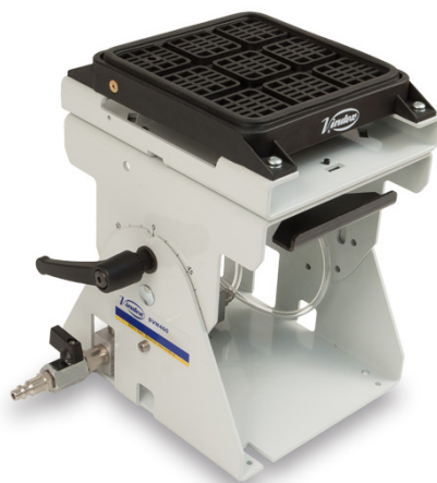
TABLE À VIDE PNEUMATIQUE SVN460 - MULTI