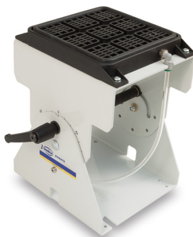
TABLE À VIDE PNEUMATIQUE SVN470 - SUPPORT AUXILIAIRE INCLINABLE 90°