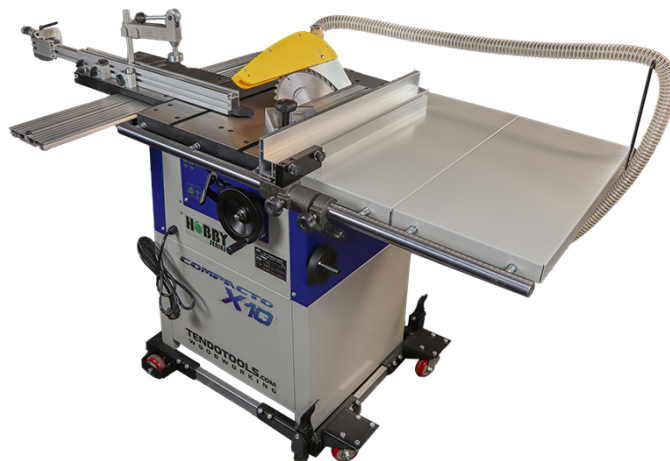
TABLE DE SCIE COMPACTO TT1000 X10