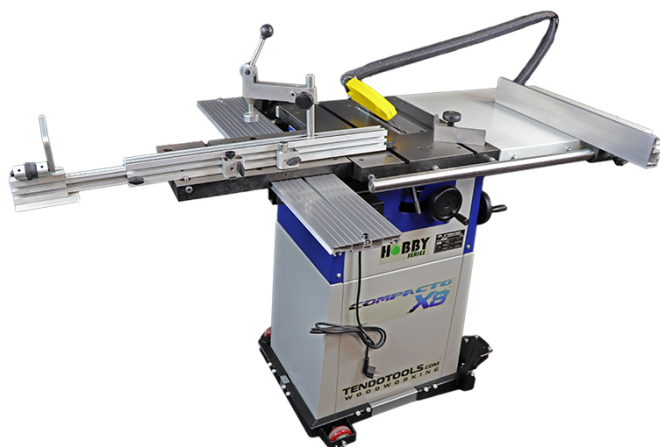
TABLE DE SCIE COMPACTO TT1000 X8