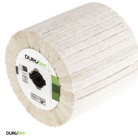
Durotec polijstborstel Duro-Polish