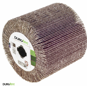
Durotec schuurborstel Duro-Flap