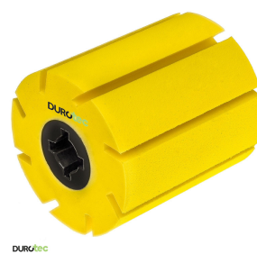
Durotec expansierol Duro-Master