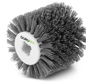
Durotec nylon borstel Duro-Nyl