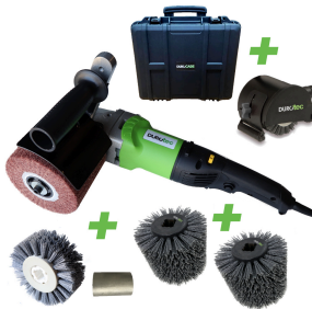
Durotec structuur borstelmachine | Promoset WOOD