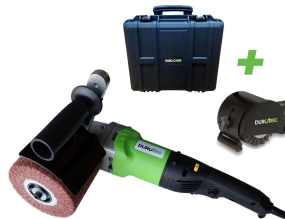
Durotec structuur borstelmachine WT100/800DE