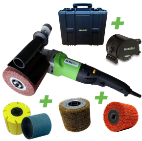
Durotec structuur borstelmachine | Promoset METAL