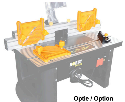
Optie / Option 1-MS-KIT-F