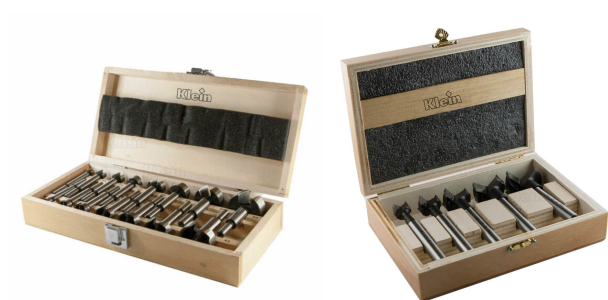
Kofferset XL cilindrische HS scharnierboor Ø10-50mm