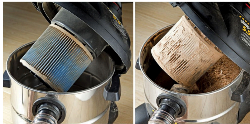
With Air Flux separator