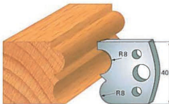
Art. SA0028 - (SA1028)