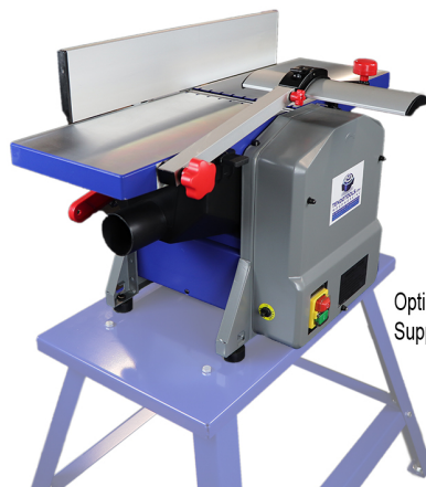
Optie / Option Support

Handige vlak- en vandiktebank die, omwille van zijn compacte design en lichte gewicht, gemakkelijk meeneembaar is. Deze machine voldoet met een breedte van 204mm en een krachtige motor probleemloos aan alle behoeften van elke hobbyist. De BARVEX Double 204 is voorzien van aluminium werktafels en een stevige aluminium geleider die tot 45° kantelt. Daarnaast zorgt de stevige stalen behuizing met poederlak voor de nodige stabiliteit tijdens het werken. Voorzien van een professionele as met twee schaafmesses. Met behulp van deze schaafbeitels heeft u een maximale werkbreedte van 204mm. Omwille van het lichte gewicht plaatst u deze machine eenvoudig op elke tafel. De BARVEX Double 204 is tevens ook voorzien van een noodstop-schakelaar aan de voorzijde.