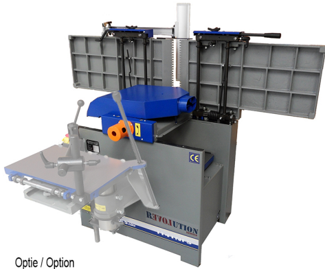
Optie / Option Boortafel / Drilling table / Table à mortaiser